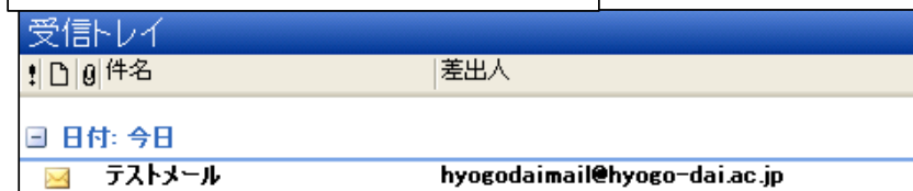
画像① プロフィール設定前